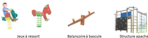
Jeux à ressort Balançoire à bascule Structure apache