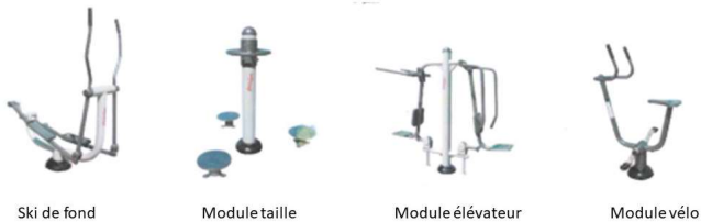
Ski de fond Module taille Module élévateur Module vélo